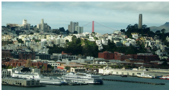
Lite dimmigare, lite långsammare, mycket trevligare.

Eftersom denna term myntades av Eno som en motreaktion på hans upplevelse av New York, dit han flyttade i slutet av 70-talet - och att stiftelsen sedan kom att baseras i San Francisco, löpte vårt samtal snart in på hur atmosfären i dessa världsstäder på motsatta kuster skiljer sig åt. Eno har beskrivit hur han kände att New York - som var och fortfarande är en extremt hetsig, omedelbar och överväldigande stad - förkroppsligade känslan av ett "kort nu", där människor enbart fokuserade på det som var intressant för stunden. Han insåg att han föredrog motsatsen, ett "långt nu" - och det hittade han inte i det stora, stinkande äpplet.