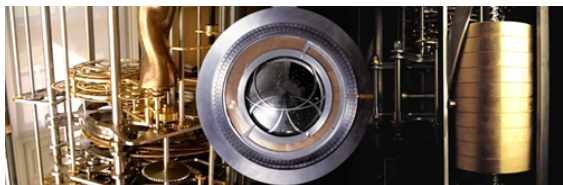
Not your grandmothers watch.

Frågan är då om San Francisco är motsatsen? I The Bay Area ligger trots allt Silicon Valley - IT-branschens mecka - som helt klart bidrar till ögonblicksfrosseniet, inte minst i form av den "instant gratification" som möjliggörs av att ständigt vara uppkopplad. Å andra sidan skulle man kunna hävda att stora delar av IT-branschen ju enbart sysslar med strävandet efter en bättre fungerande framtid, även om det ofta blir så fel, så fel. På många andra plan är det dock odiskutabelt att den här stan är ett passande geografiskt ramverk för utvecklandet av ett långsiktigt tänkande. Klyschan om det tillbakalutade Kalifornien stämmer delvis, och lägg där till en miljöpolicy , som är bland den mest progressiva i USA, samt en uppsjö av slow food, hållbar kultur och reflexiva dialoger.